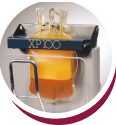
Components Extraction Extraction des composés sanguins