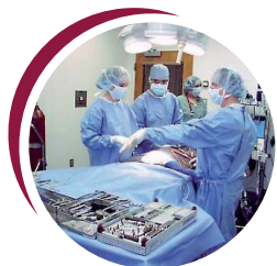
Use of Blood Components Utilisation des composés sanguins

AWEL contributes to the safety of the blood transfusion throughout the process, from blood collection up to the use of blood components. Productivity - Automation - Complete Traceability.