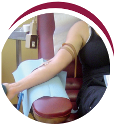
Blood Collection Collecte