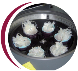
Centrifugation Centrifugation des poches